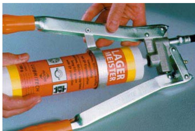
5. Skruva i patronen i fettsprutan.