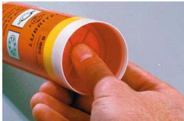
4. Avlägsna all eventuell överskottsluft i anslutningsgöngen genom att trycka lätt på kolven.