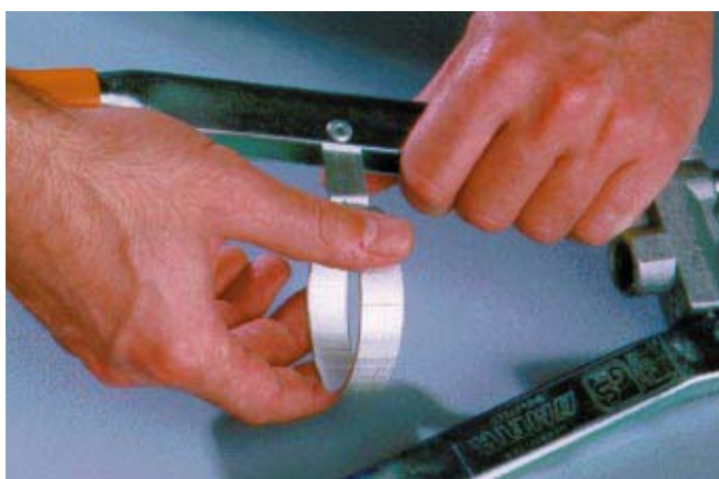
2. Vrid stödringen till rätt vinkel.