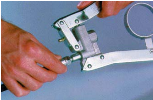
1. Skruva på slangen.