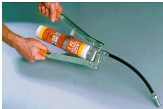
6. Kontrollera korrekt funktion, därefter är fettsprutan klar för användning.